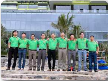
Hình ảnh ban lãnh đạo công ty

KHÔNG NGỪNG MỞ RỘNG ĐỂ PHỤC VỤ QUÝ VỊ TỐT HƠN VÀ NHANH HƠN NỮA !